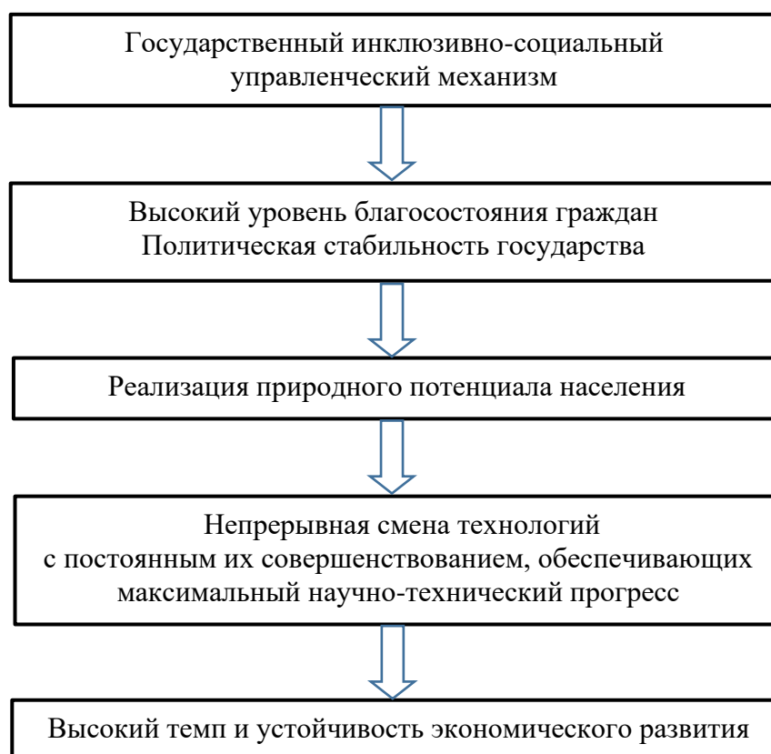
Рис. 2. Реализация достижения эффективного экономического развития