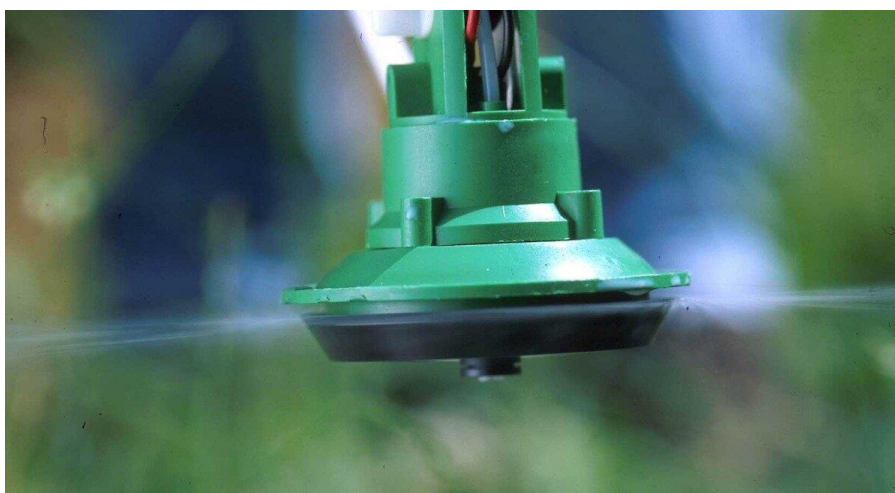
Рис. 2. Вращающийся распылитель Micromax

Большое влияние на результат при применении УМО оказывают скорость ветра, восходящие потоки воздуха от земли при испарении и относительная влажность воздуха. Для решения задачи максимально эффективного применения химических препаратов и обеспечения качественной защиты посевов сельскохозяйственных культур разработали технологию контролируемого капельного опрыскивания с использованием вращающихся распылителей Micromax специальной конструкции (рис. 2).