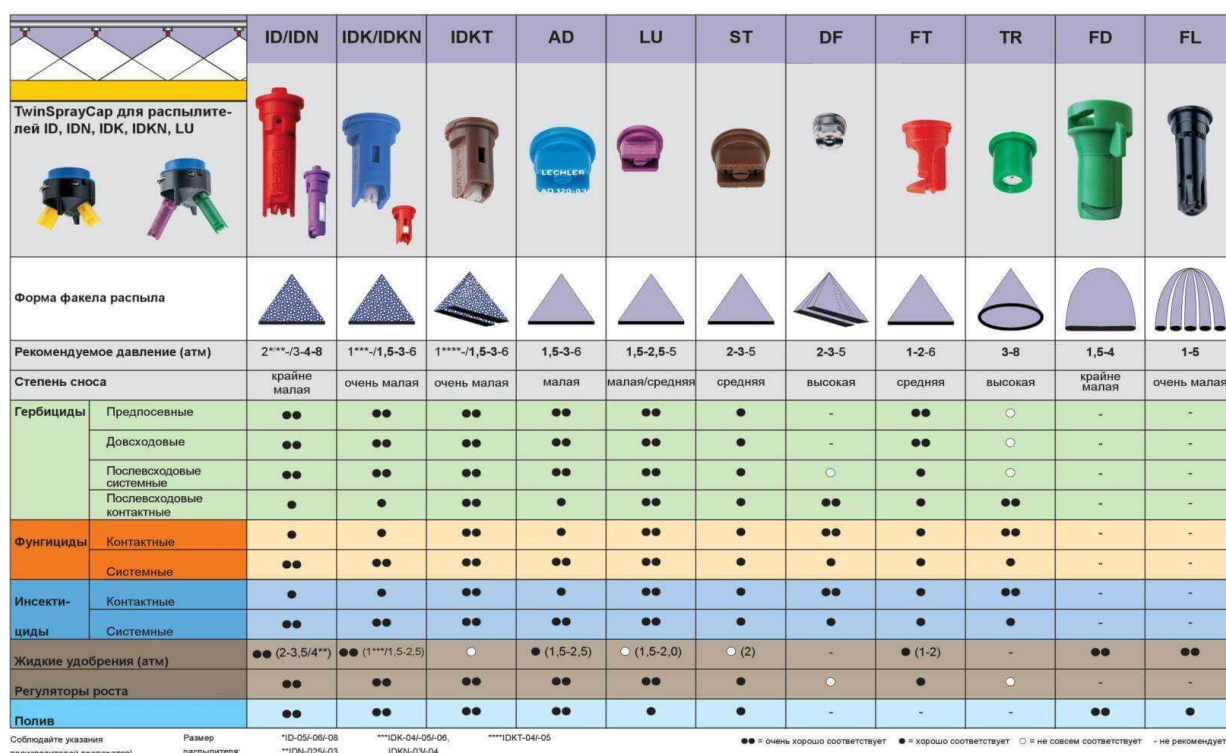
Table 1. Scheme of application of nozzles for spraying field crops

Схема составлена для оптимальных погодных условий при опрыскивании – температуры до 25 °С, влажности более 60 %, скорости ветра менее 5 м/с. Важно отметить, что оптимальная температура для роста и развития кукурузы приблизительно такая же и составляет: дневная +22–25 °С, ночная +18 °С. Пороговые температуры, при которых прекращается прирост биомассы, – ниже +10 и выше +30 °С 4 .