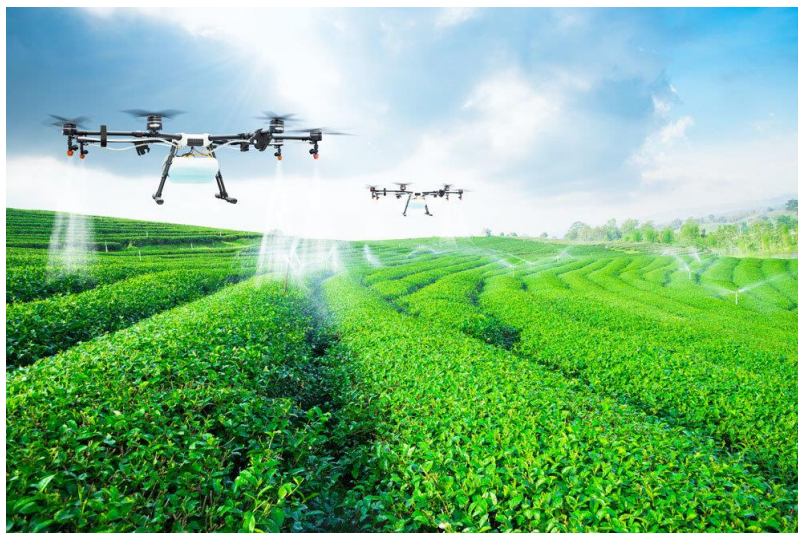
Рис. 3. Опрыскивание БПЛА