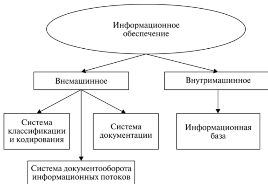
Рис. 2. Структура информационного обеспечения

Структура информационного обеспечения представлена на рисунке 2.