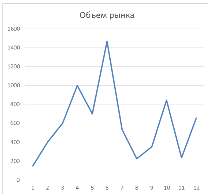
Рис. 3. Графическое представление объема рынка Fig. 3. Graphical representation of market volume

Во время запуска приложения в тестовом режиме было проведено исследование следующих показателей: количество просмотров страницы продукта, коэффициент конверсии, количество сеансов на одно активное устройство, сбои и общее количество загрузок. На основе анализа данных всех показателей были сделаны выводы о востребованности приложения. Текущий анализ показал положительные результаты. Графики соответствующих показателей приведены на рисунке 4.