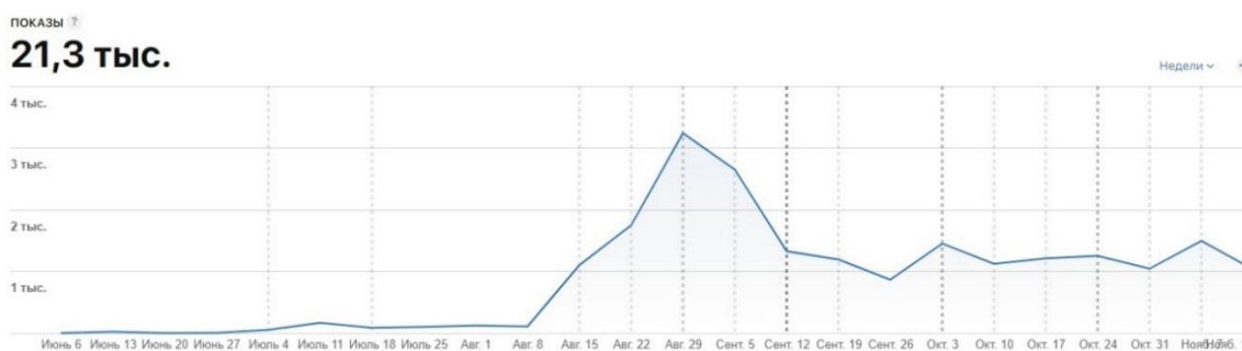
Рис. 2. Количество показов в период с 01.05.2022 по 14.11.2022

Разрабатываемое клиентское приложение изначально было выпущено в демоверсии на короткий срок – для возможности оценки динамики его установки, выстраивания общего рейтинга, корректировки визуальной составляющей, а также для устранения программных ошибок, выявленных в ходе тестирования на основе отзывов. На рисунке 2 представлен график, показывающий количество показов в App Store.